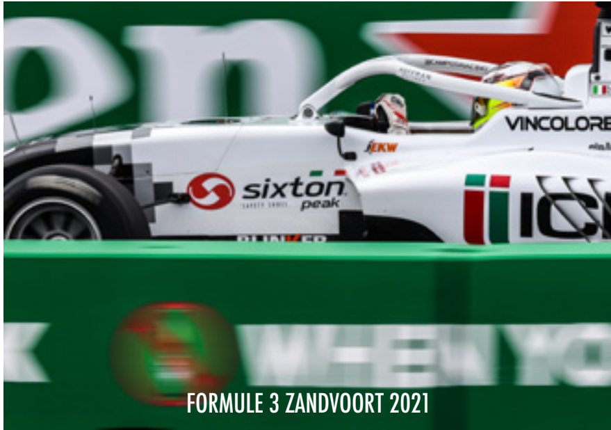
FORMULE 3 ZANDVOORT 2021