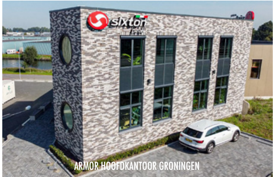
ARMOR HOOFDKANTOOR GRONINGEN