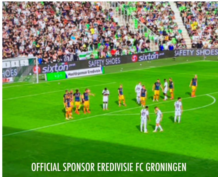
OFFICIAL SPONSOR EREDIVISIE FC GRONINGEN